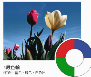
4段色輪 (紅色、藍色、綠色、白色)*