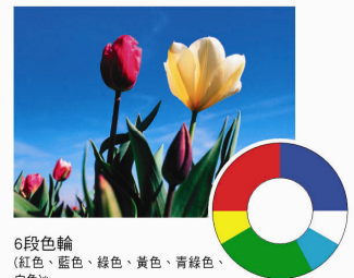
6段色輪 (紅色、藍色、綠色、黃色、青綠色、白色)*