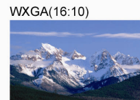
顯示完全自然尺寸畫面

16:9寬螢幕在影像設備和電腦使用上越來越普遍，而PG-D3050W投影機使用寬螢幕相容的WXGA(1280x800)解析度，能提供比標準XGA(1024x768)解析度大出1.3倍的可見區域，並能以完全自然的尺寸輸出有線電視、衛星訊號和DVD光碟自然寬廣的影像畫面。